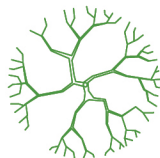
STÁVAJÍCÍ VZROSTLÁ ZELEŇ (LISTNATÉ STROMY)